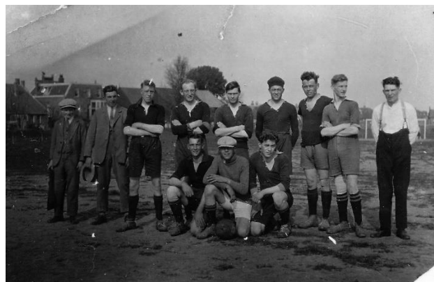
Op de IJspolder.